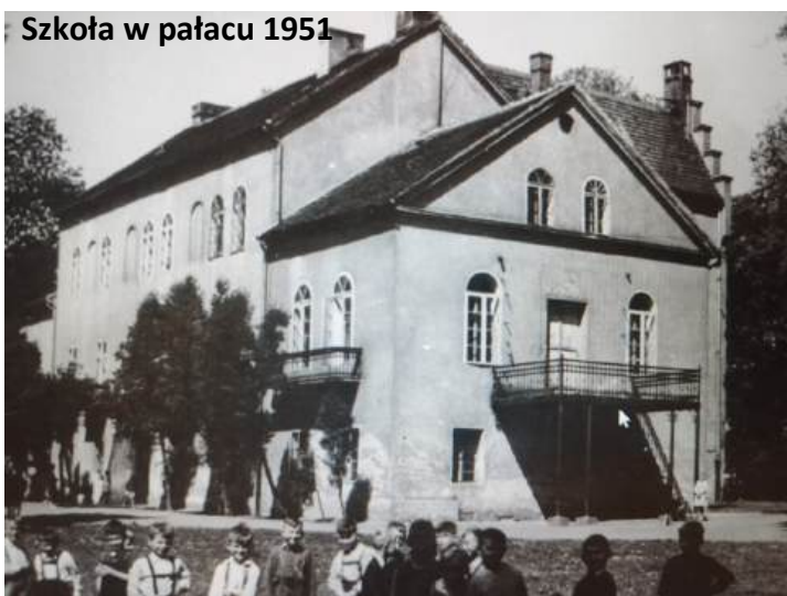
Szkoła w pałacu 1951

Od 18.06.1914 r. majątek Durantów w Baranowicach stanowił już własność przedsiębiorstwa Bergwerksgesellschaft Georg von Giesche's Erben AG.