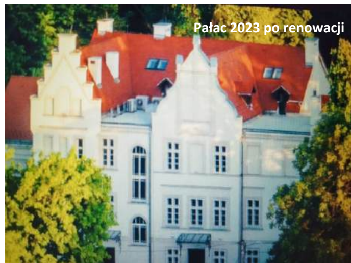
Pałac 2023 po renowacji