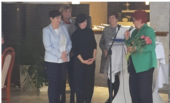
Prezes Okręgu Śląskiego dziękuje wodzisławskim związkowcom za wieloletnią i bardzo skuteczną pracę.