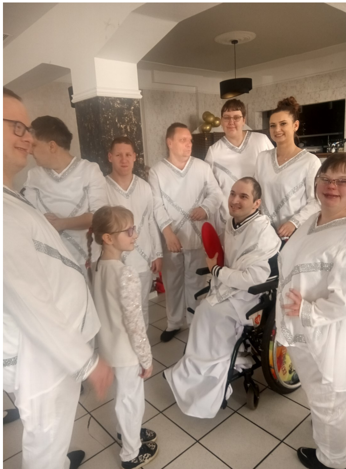
Podopieczni świetlicy „Radość Życia” przedstawiają swój program.